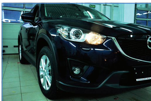
Штатная лампа P13W