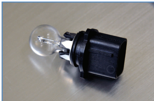
Штатная лампа P13W