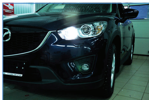
Новая лампа FS-CX5